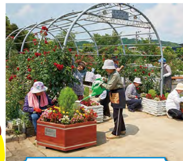
フラワープランター