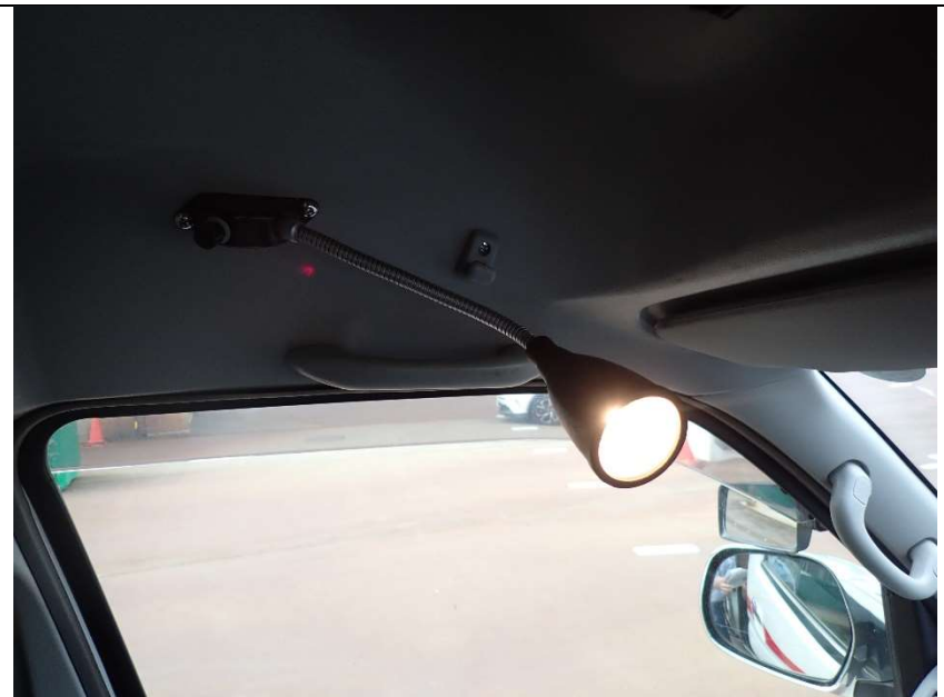
運転席マップライト点灯