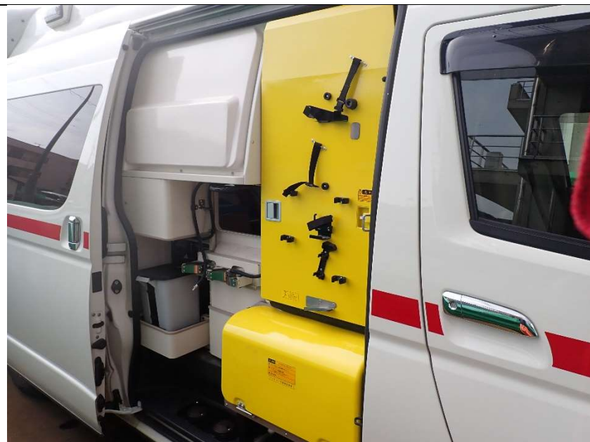
助手席側スライドドア開放（バッテリー等収納）