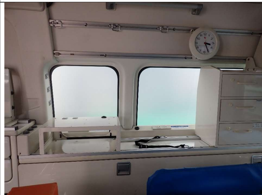
患者室運転席側中央収納