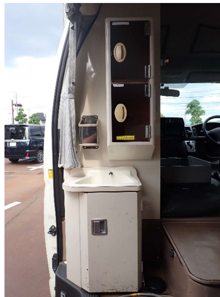
助手席側前方収納