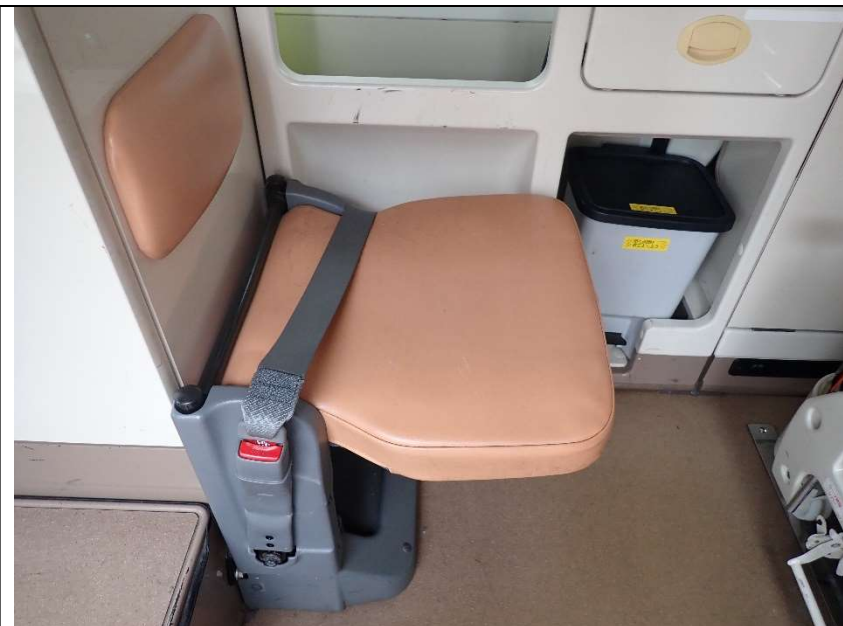
患者室運転席側前方シート