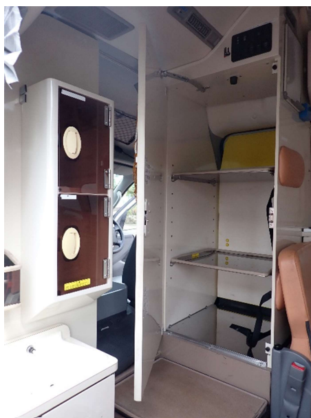
運転席側前方収納