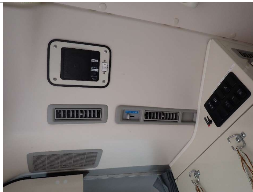
患者室前方エアコン操作部（無線スピーカー穴有り）