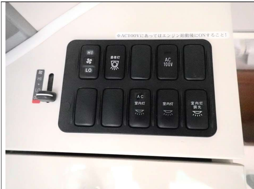
患者室灯火類スイッチ