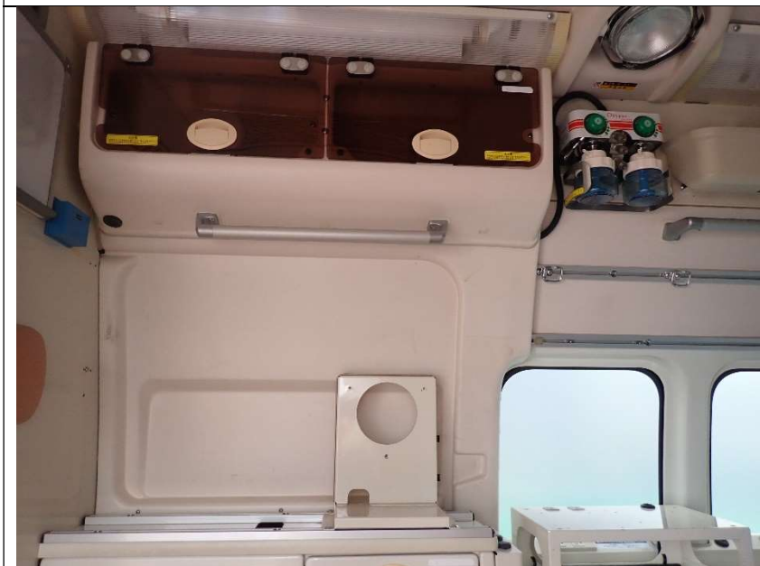
患者室運転席側前方上部収納