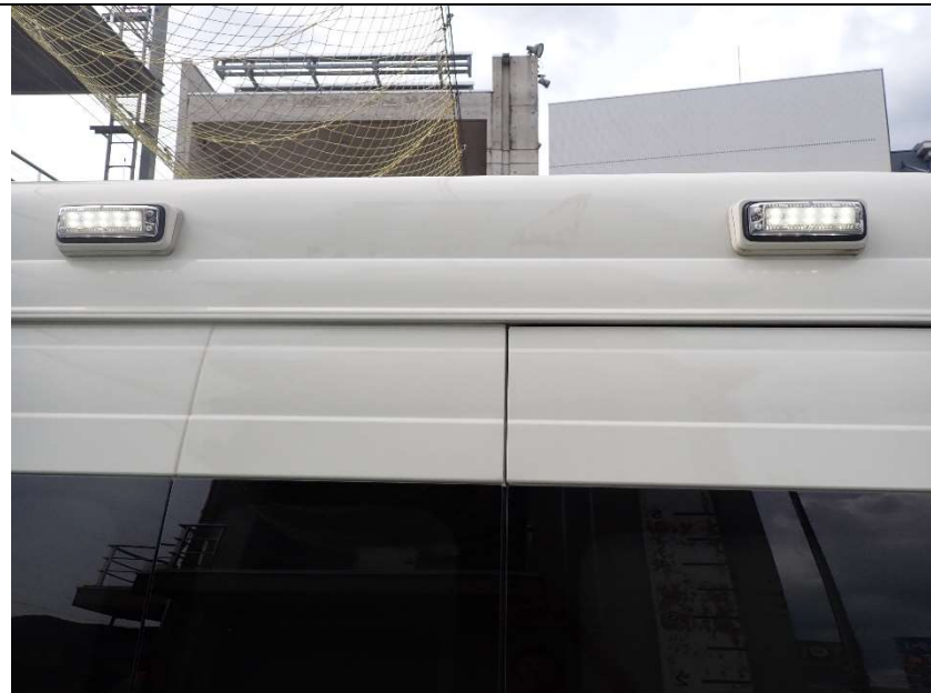
運転席側車両外部作業灯点灯状況（助手席側も同様）