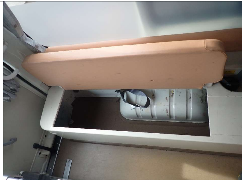
患者室助手席側後部シート内収納