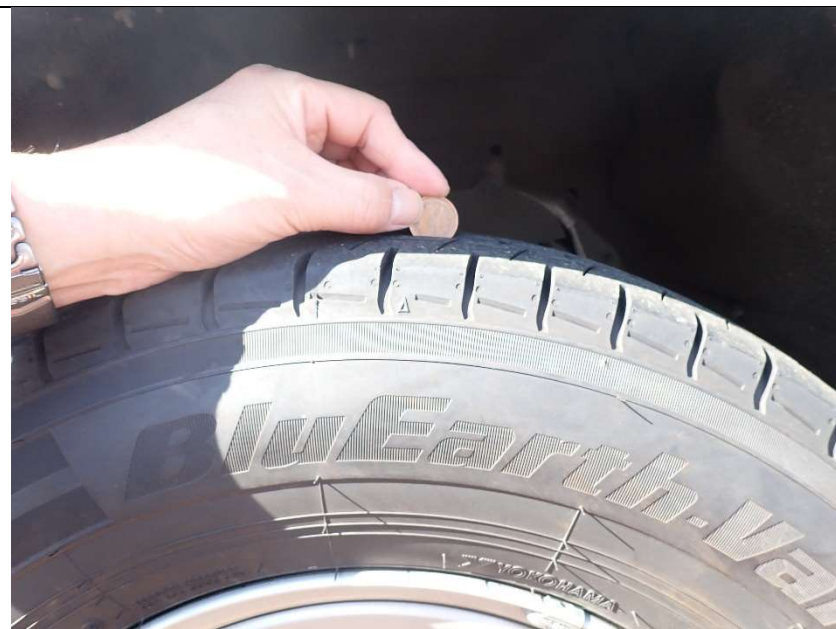
タイヤ残り目状況