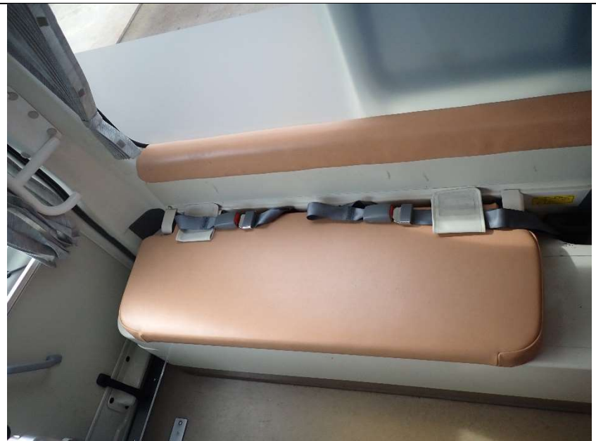
患者室助手席側後部シート