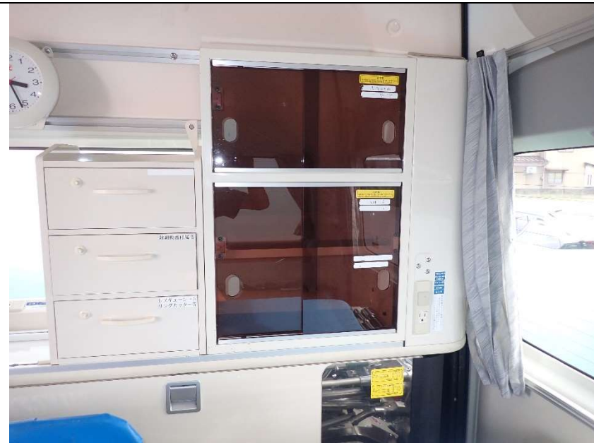
患者室運転席側後部収納