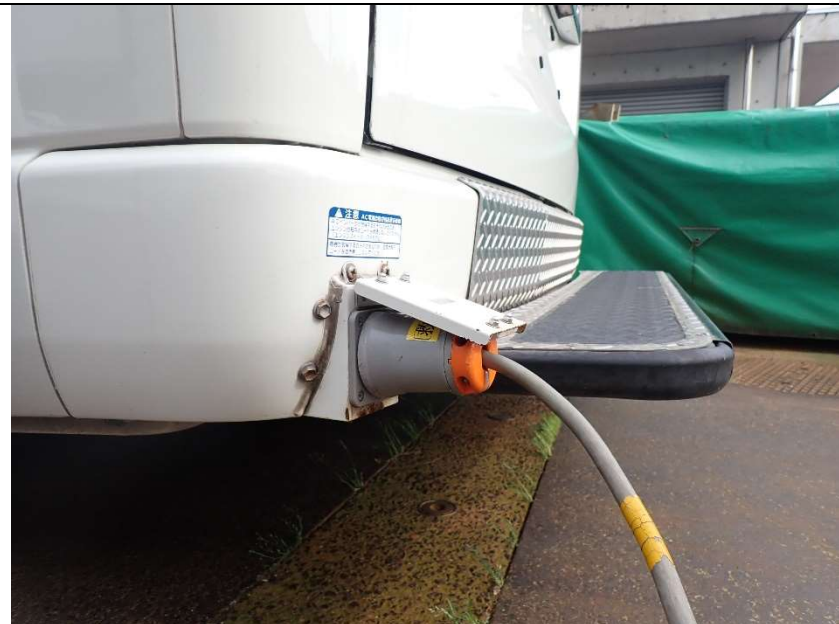
バッテリー充電コード接続状況