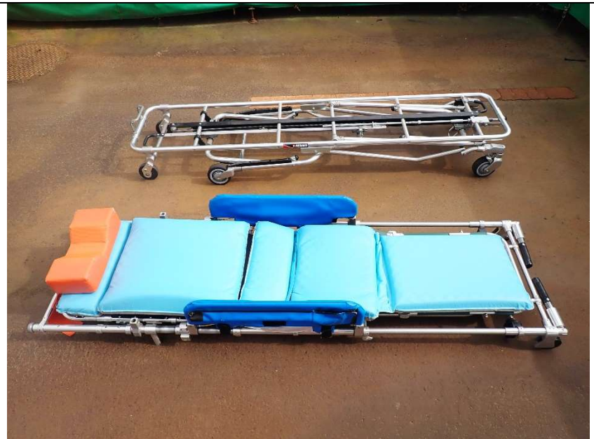
ストレッチャー（担架離脱状態）

掲載している写真は、K S I 官公庁インターネットオークションの出品フォームに掲載している写真を含みます。