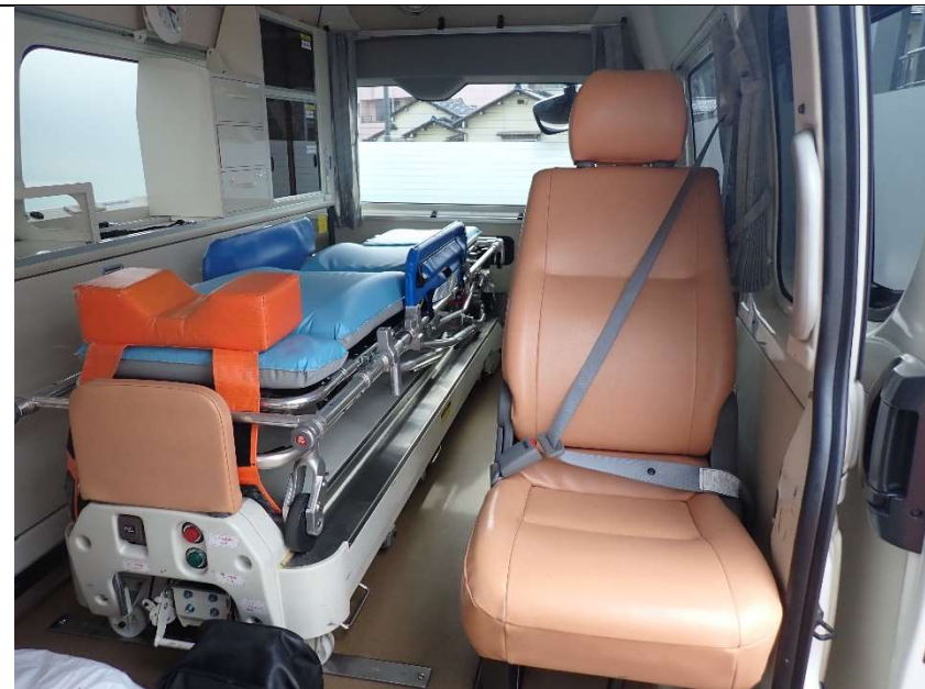
患者室助手席側シート