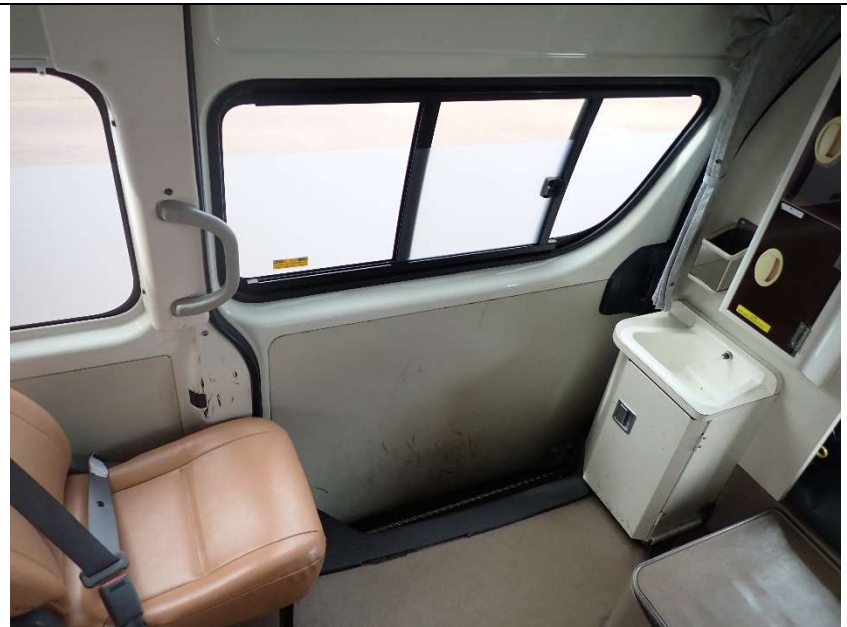
助手席側スライドシート内張