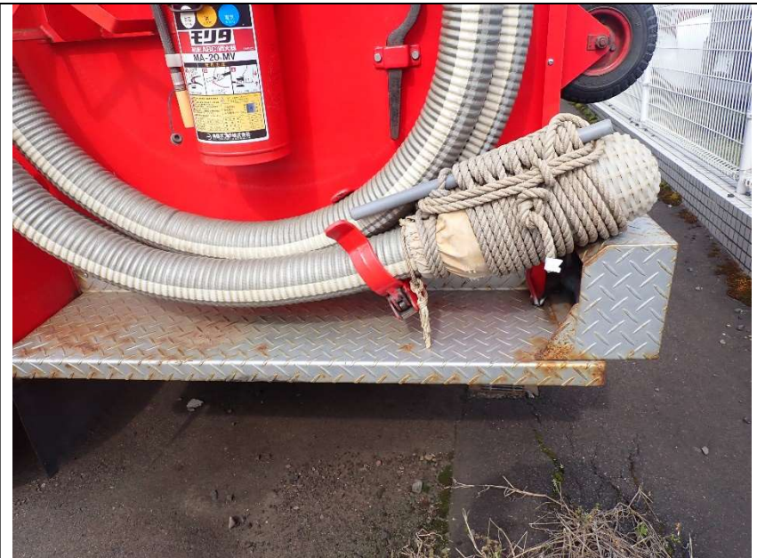
ステップの錆（助手席側）

掲載している写真は、K S I 官公庁インターネットオークションの出品フォームに掲載している写真を含みます。