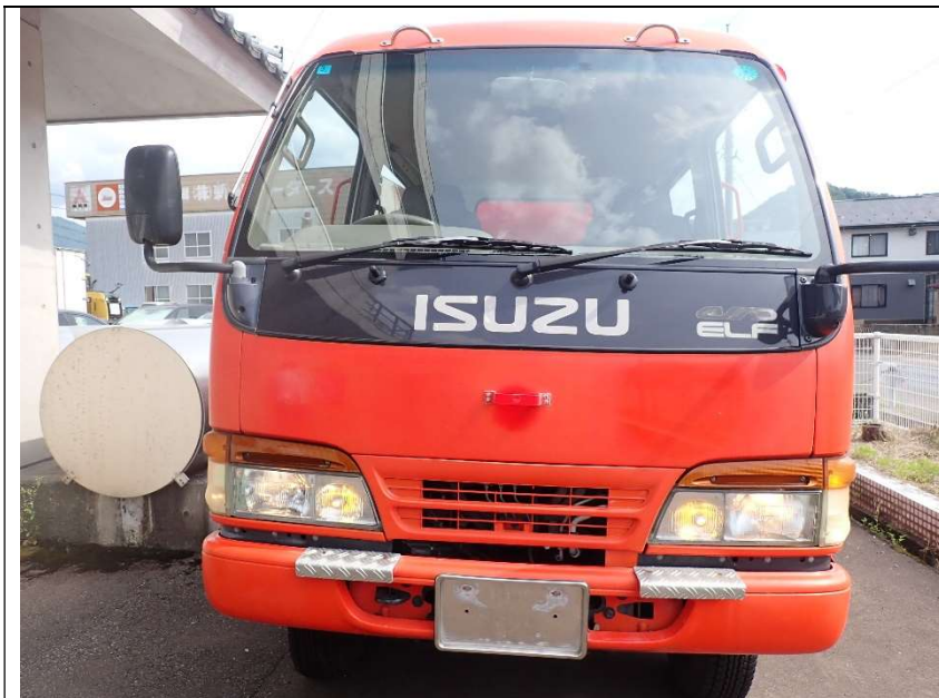
車両前面(灯火類点灯)

区分番号 南越(車)2026-01 CD-1型消防ポンプ自動車 いすゞ 平成9年3月初度登録