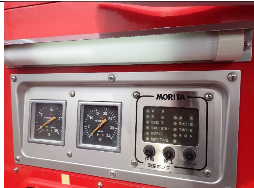
ポンプ作業灯の点灯状況(運転席側)