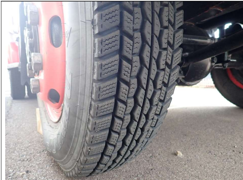
タイヤ残り目の状況（運転席側前輪を撮影）