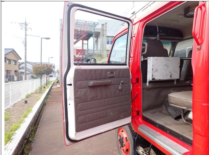
助手席側後部ドア内張