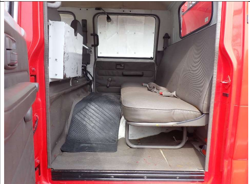
助手席側後部座席足元