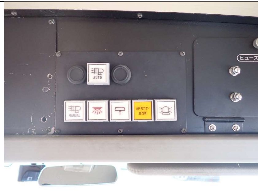
AP モニター主スイッチ、ポンプ灯のスイッチ等