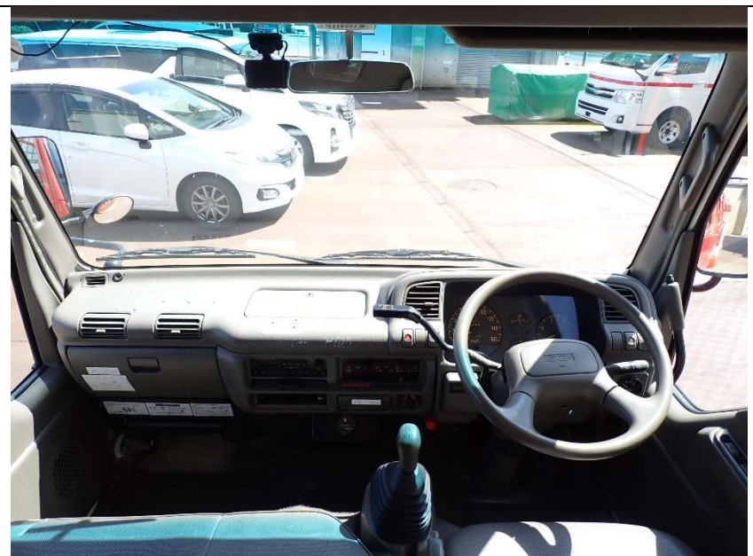
ハンドル周辺 (シフトノブ、4WD 変速、ポンプレバー等)