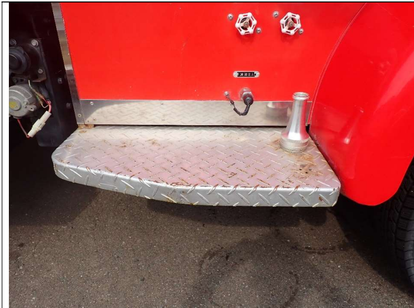
ステップの錆（助手席側）