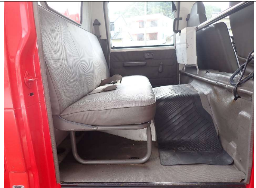
運転席側後部座席足元