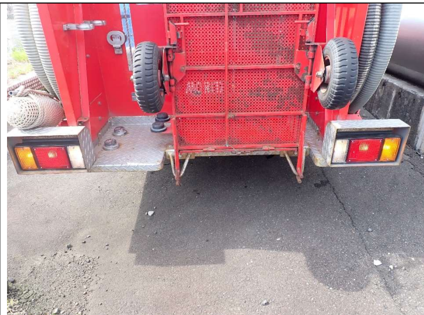
車両後面(灯火類点灯)