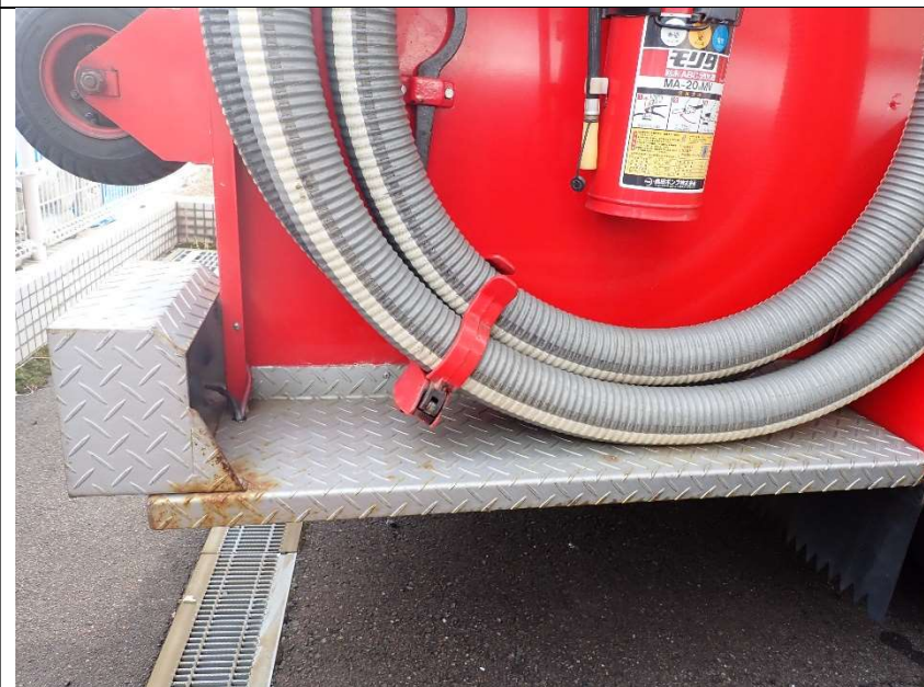
ステップの錆（運転席側）