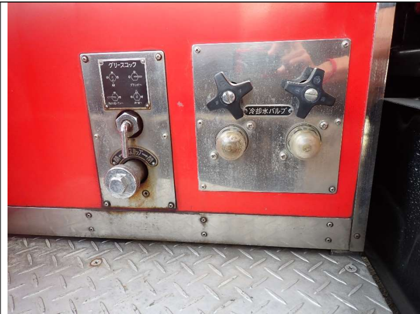
冷却水バルブ、グリースコック