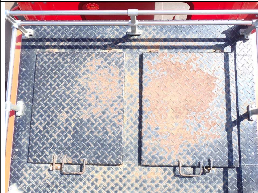
収納庫上段点検口蓋