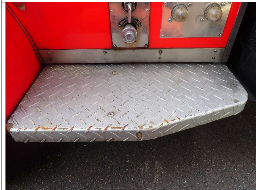
ステップの錆（運転席側）