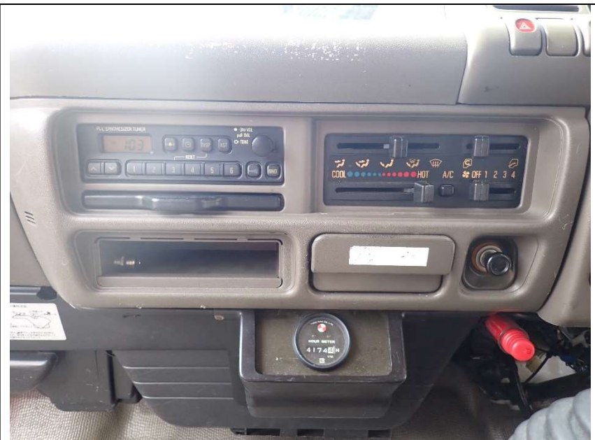
ラジオ、エアコン等