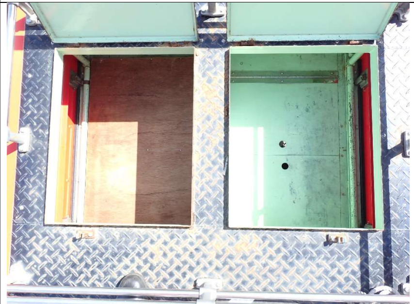
収納庫上段点検口蓋開放