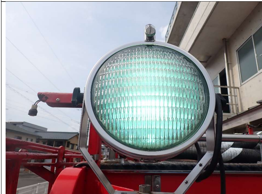
後部作業灯の点灯状況