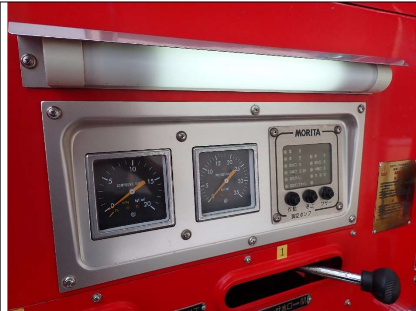
ポンプ作業灯の点灯状況（助手席側）