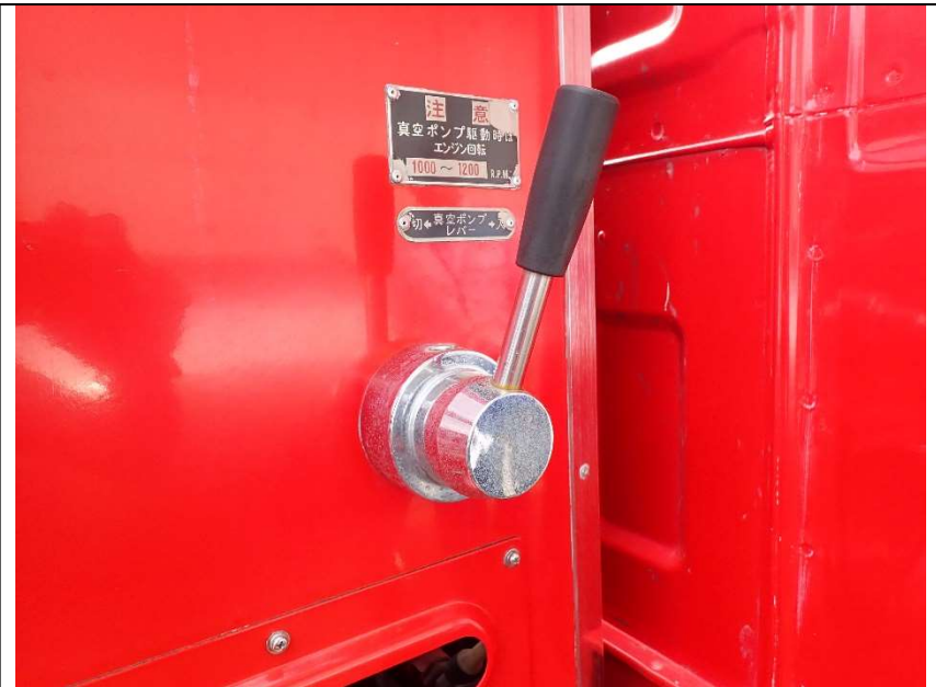
運転席側後部手動ポンプレバー