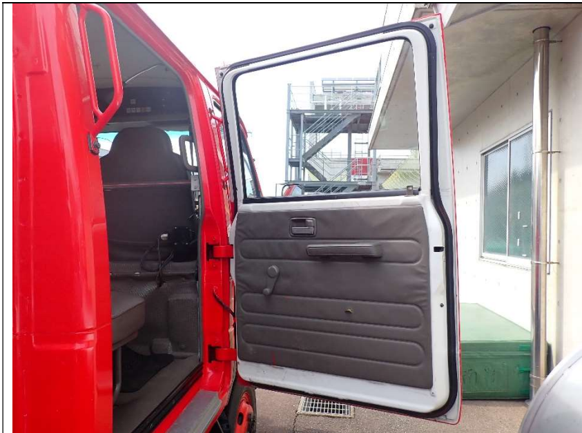
運転席側後部ドア内張