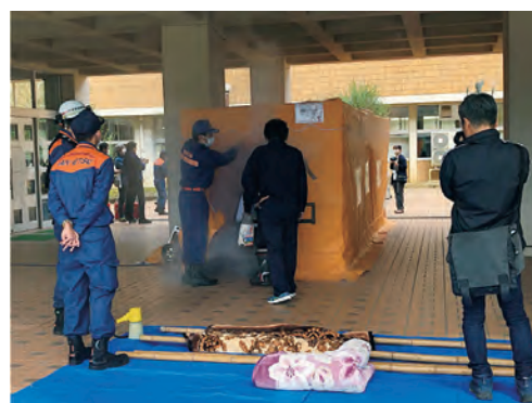
テント内で煙の怖さと避難方法を体験する参加者