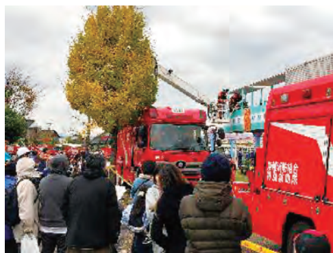
モノレールを利用した高所救助訓練