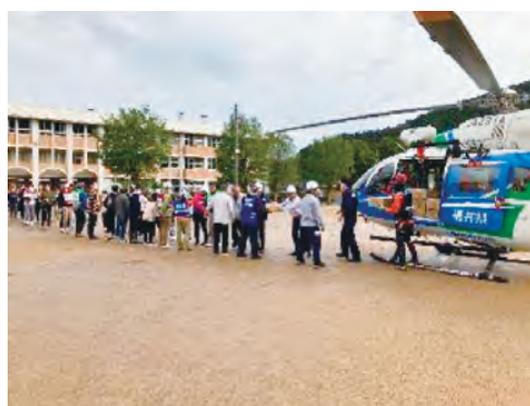
防災ヘリコプターからの物資搬送訓練