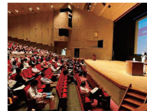
文化センター会場の様子 (6月7日)

※ご不明な点は事務局までお問い合わせください。 (中消防署21-8899、東消防署43-0119、市防災危機管理課22-3081)