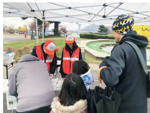
外国人市民に説明する外国人市民防災リーダー