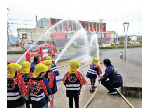
幼年消防クラブ員による放水体験 (防災ふれあいプラザにて)

市内の全31箇所の保育園、幼稚園及び認定こども園の園児623名で編成された越前市幼年消防クラブに育成費を交付して、幼年期における防火・防災意識の啓発に努めています。