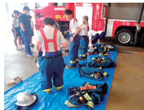
少年消防クラブ員による防火服の着装体験 (リーダー研修会にて)

市内の全17小学校児童678名で編成された越前市少年消防クラブに育成費を交付して、クラブ活動を支援し、児童とその家庭の防火・防災意識の啓発に努めています。