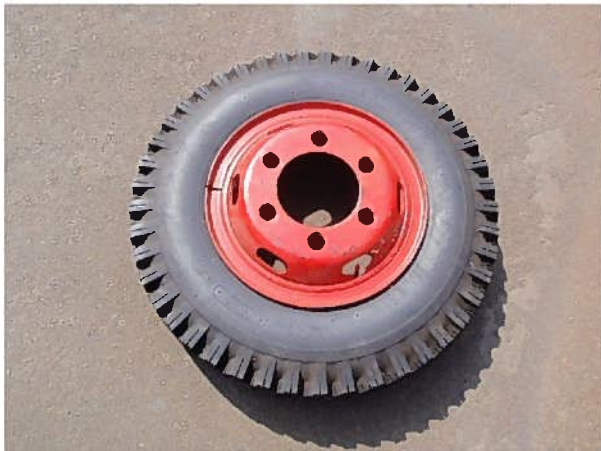
スペアタイヤ（スタッドレス） （ラジアルタイヤは車両底面に積載）