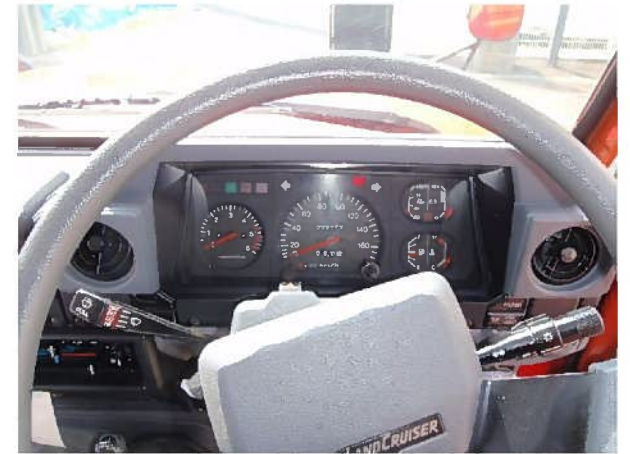
インストルメントパネル