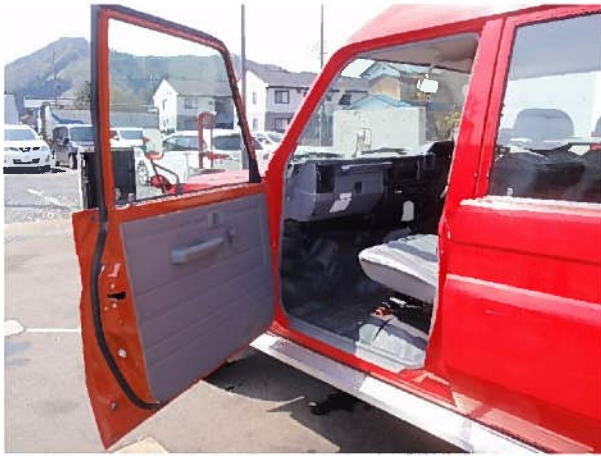
ドア内張り（助手席）