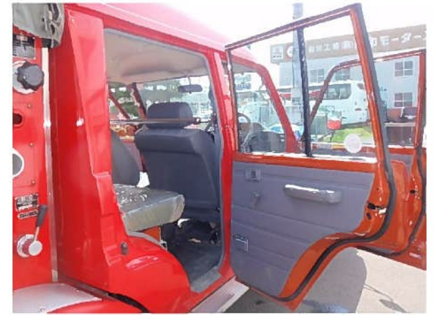
ドア内張り（運転席側後部）