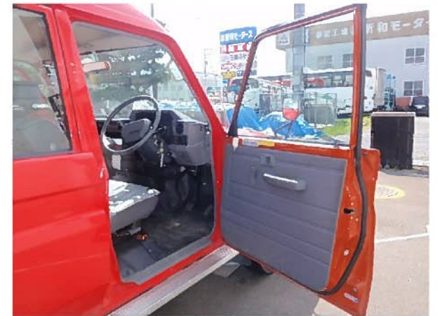
ドア内張り（運転席）