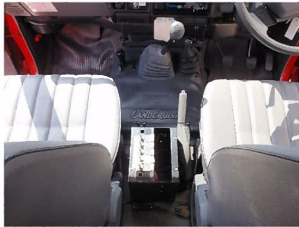
センターコンソール周囲