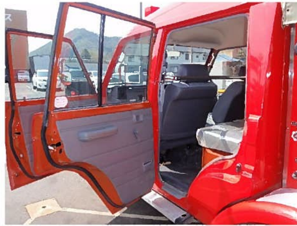
ドア内張り（助手席側後部）