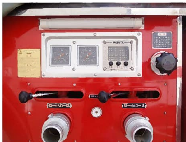
運転席側放水口周囲(右側放水口から軽微な漏水有)