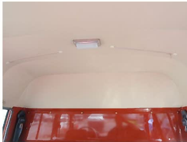
天井内張り（後部座席側）