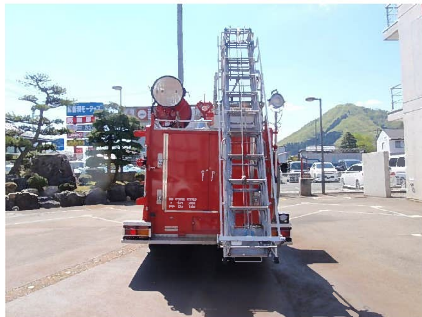
三連梯子昇降装置 (三連梯子は付属しません)