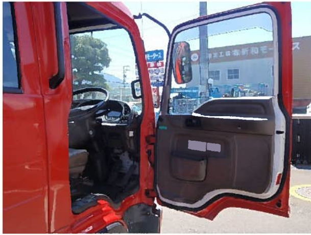
ドア内張り（運転席）