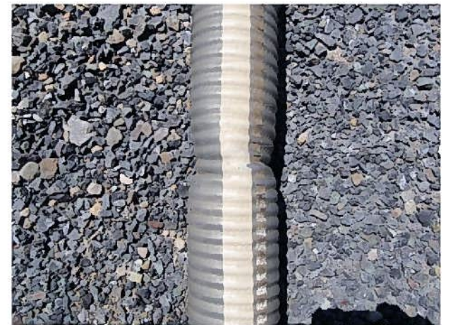
吸水管の変形状況