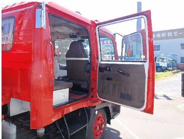
ドア内張り（運転席側後部）