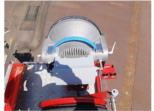
上部大型サーチライト（発電機無し）