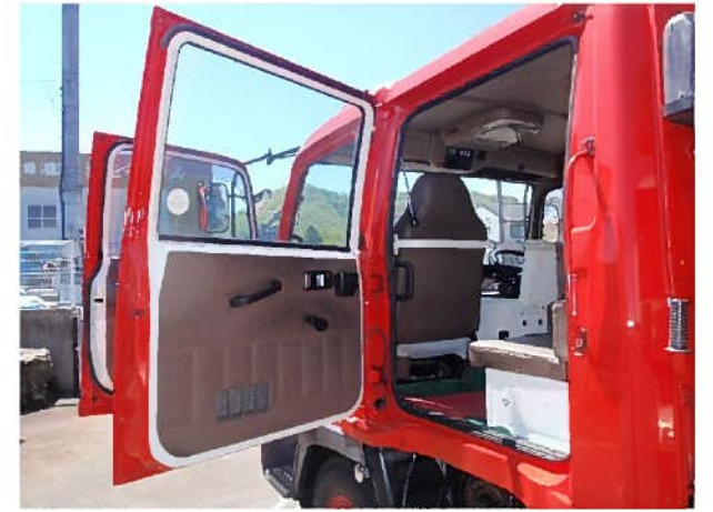
ドア内張り（助手席側後部）