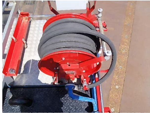
上部ホースリール