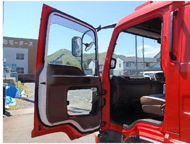
ドア内張り（助手席）