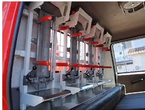
空気呼吸器ホルダー（後部座席）